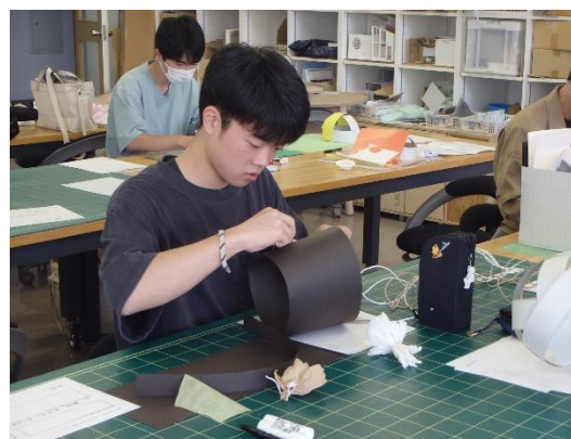
デザインスクール (2 学年)