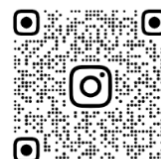
OTO_KOH2 卒制 Instagram