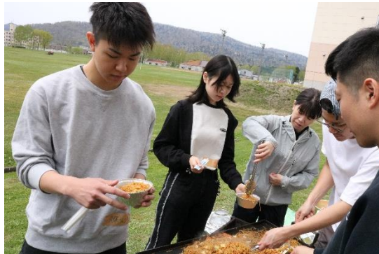
新入寮生歓迎会（5月）