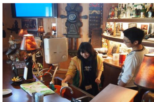
過去のボランティア活動の様子