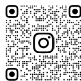
OTOKOH_SNS 学校 Instagram