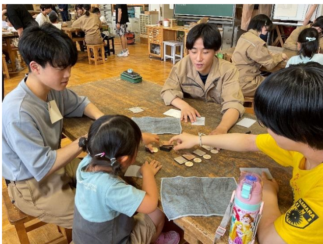
学校間連携（村内幼稚園、小中学校との連携授業）

また、インターンシップや一日体験入学、村内の幼稚園、小中学校との連携授業を通じた交流も行なっています。