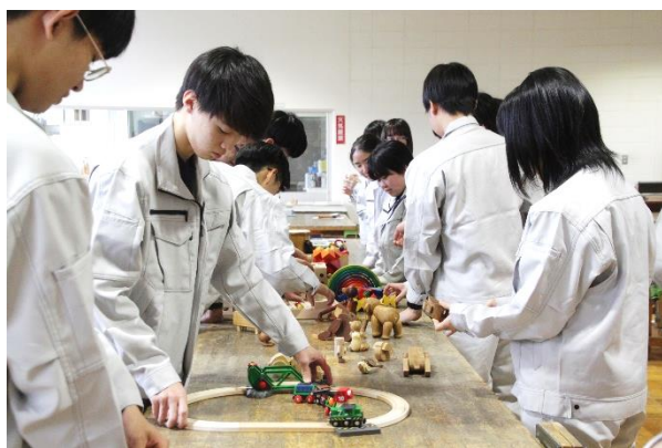
連携授業 (1 学年)